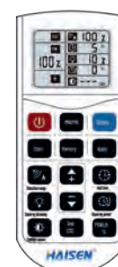
960005 MANDO DE CONTROL REMOTO HD05R COMANDO DE CONTROL REMOTO HD05R